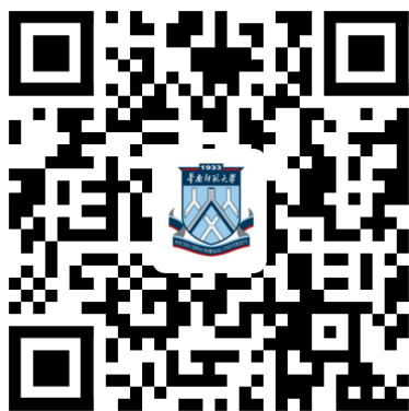
图 2 校园统一支付平台 二维码