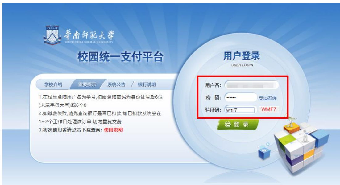
图1 校园统一支付平台登陆界面

在浏览器地址栏输入： http://hscwxf.scnu.edu.cn ，打开“华南师范大学校园统一支付平台”，如图1所示。