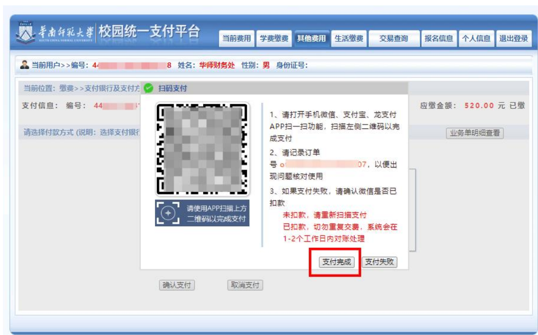
图 5 网上支付