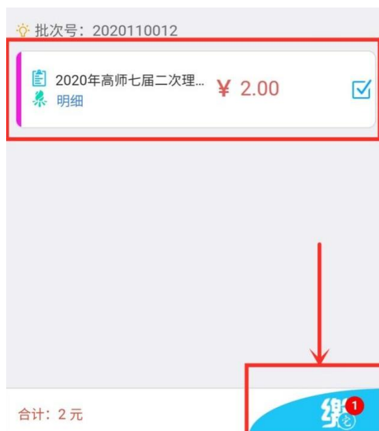
图 6 缴费项目

3. 进入支付界面，支付方式可选择： 微信支付 、建设银行、建设银行聚合支付（支持微信、支付宝支付），如图 7。