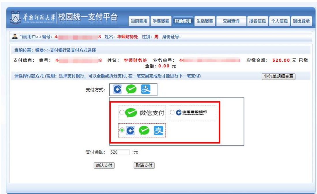
图 4 缴费方式选择

4. 核对支付金额。确定支付金额无误后，选择支付方式，点击“确认支付”，将会弹出付款二维码，请使用微信、龙支付、支付宝进行扫码支付，如图 5 所示。