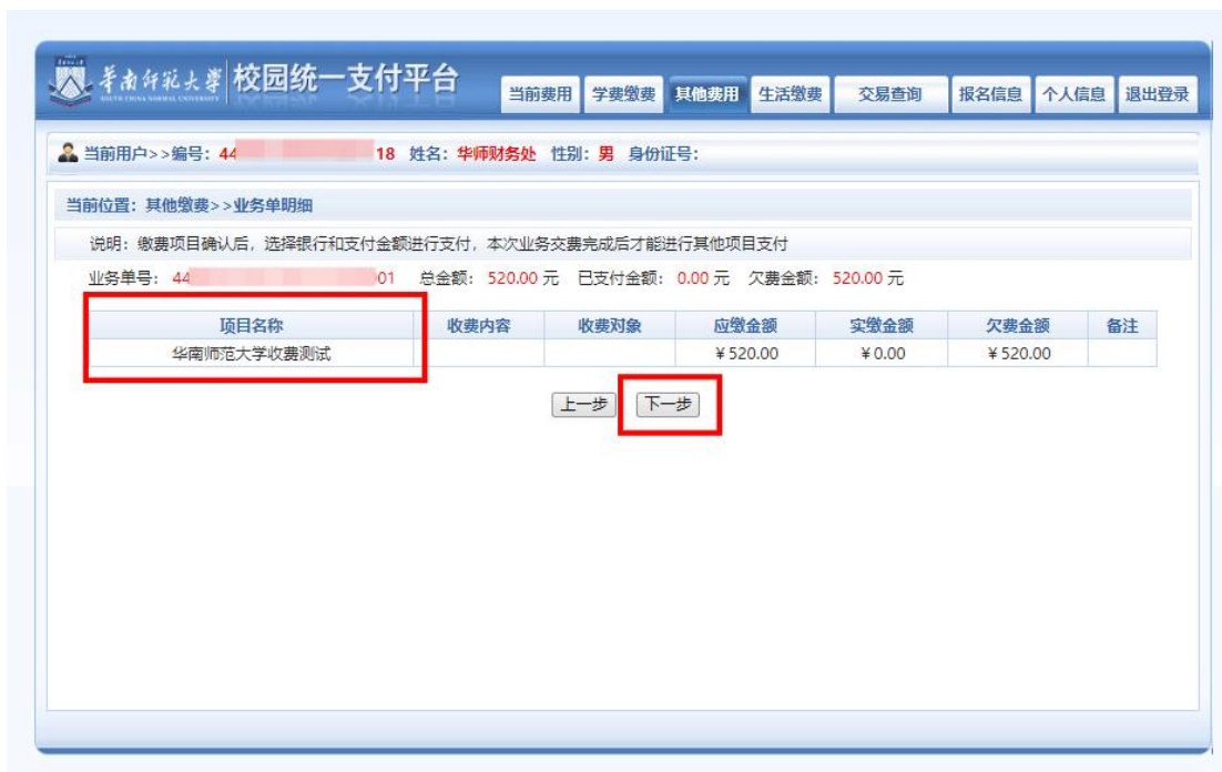
图 3 缴费信息