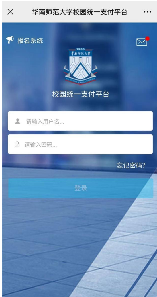
图4 校园统一支付平台 登陆界面