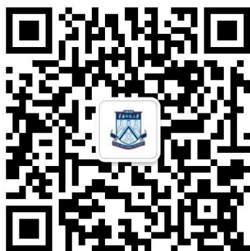
图 1 微信公众号二维码

点击“业务办理”——“统一支付平台”，如图 1。打开“华南师范大学校园统一支付平台”，如图 2 所示。